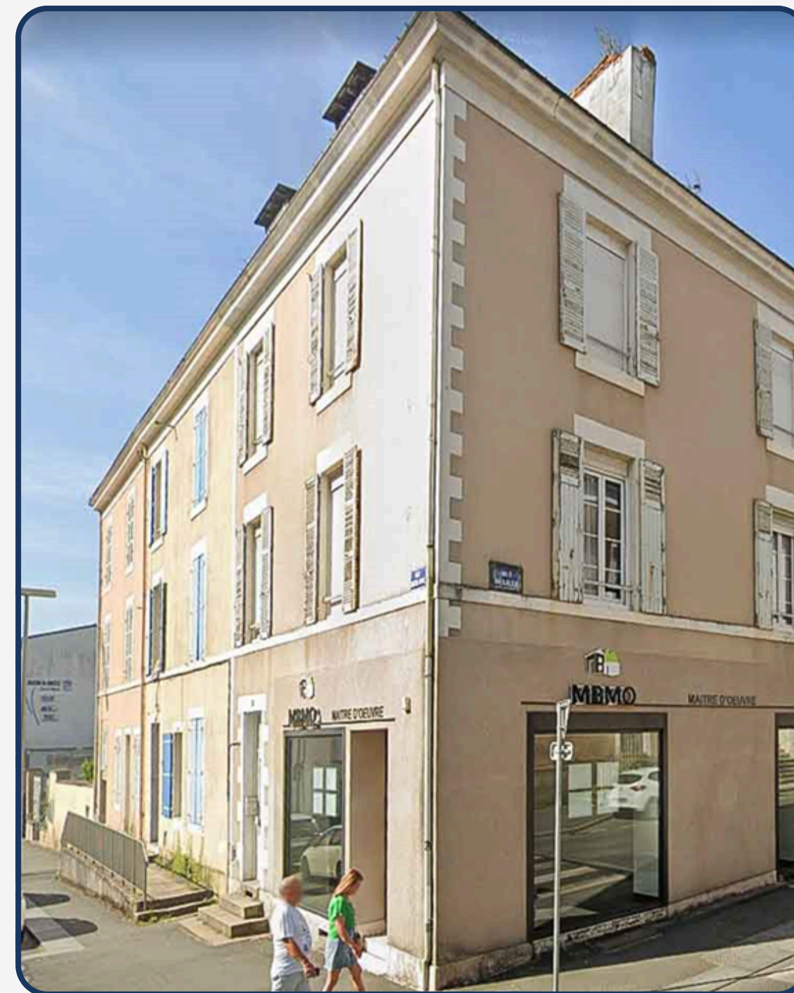
6 rue Maréchal Joffre 85000 La Roche sur Yon

47K€ de CA pour les agences contre 20k€ estimés pour 4 lots + gestion du syndic.