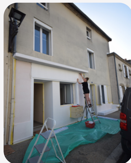
15 place de l'Eglise 85610 Cugnand