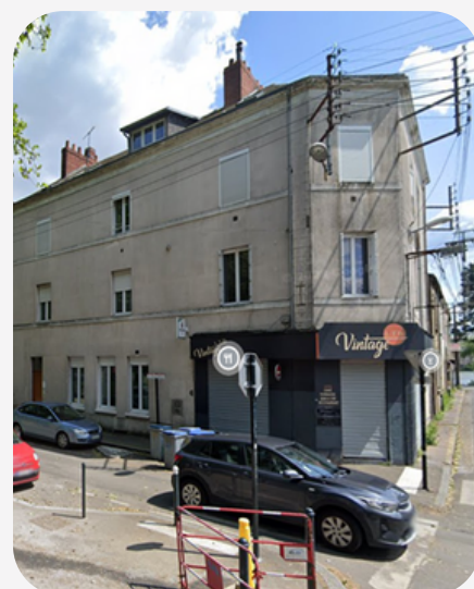
43 rue Bougainville 44000 Nantes