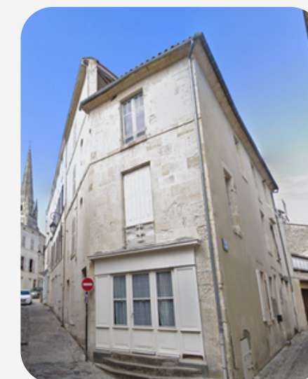
1 rue de la Harpe 85200 Fontenay le Comte