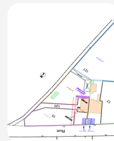
65 rue de Fontenay 85200 Saint Michel Le Cloucq